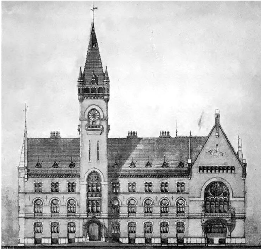
Ifj. Sándy Gyula „Erő-Eszme-Jóság” jeligével benyújtott pályaművének homlokzatraja az 1894-es győri városháza tervezési versenyén. | Magyar Építőművészeti Pályázatok , 1894. 2. f. 28. p.