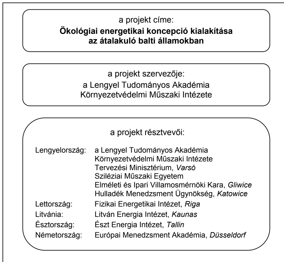
1. ábra Az „Ökológiai energetikai koncepció kialakítása a balti államokban” c. kutatás felépítése

Az energiafelhasználás hatékonyságának az átalakulás utáni viszonyok között végzett vizsgálata során módszertani nehézséget jelent a korlátozottan rendelkezésre álló tapasztalat, mert így nincs lehetőség valószínűség-számítási módszerek alkalmazására. Ezért a Kelet- és Közép-Európában inkább jellemző nehezen definiálható paraméterekhez és kapcsolatokhoz használható modelleket alkalmaznak. Ilyen nehezen definiálható (részben nem gazdasági, „fuzzy”) paraméterek például: